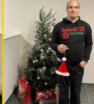
Ik wens iedereen een fijn Nieuwjaar en een leuke kerstfeest!